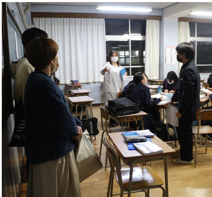
①放課後課外見学 17:30 - 18:00