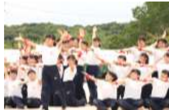
運動会(女子マスゲーム)