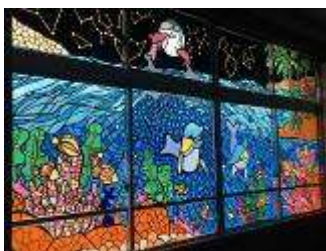
鞍高祭(スタンドグラス)