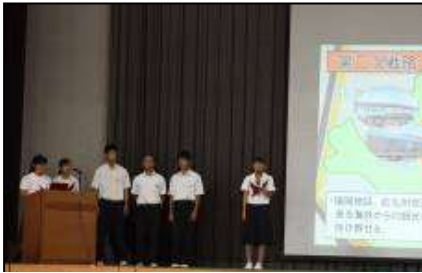
文化祭での課題研究発表の様子

下の写真は普通科SGHドリームプラン班「電車ホテル～田舎に泊まろう！」の発表の様子です。日本政策金融公庫主催「高校生ビジネスプラン・グランプリ」ベスト100に入賞しました。