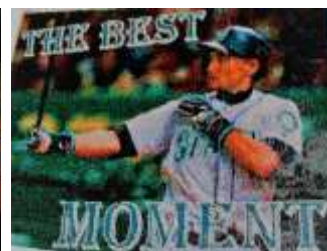
鞍高祭(つま楊枝アート)