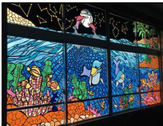
鞍高祭(ステンドグラス)