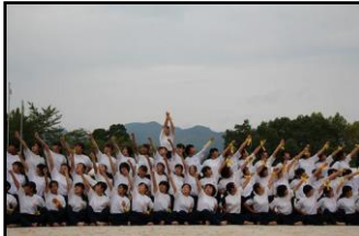
運動会(女子マスゲーム)