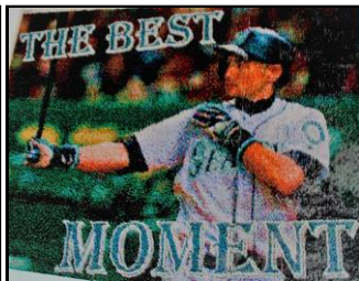
鞍高祭(つま楊枝アート)