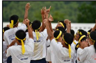
運動会 1位決定の瞬間