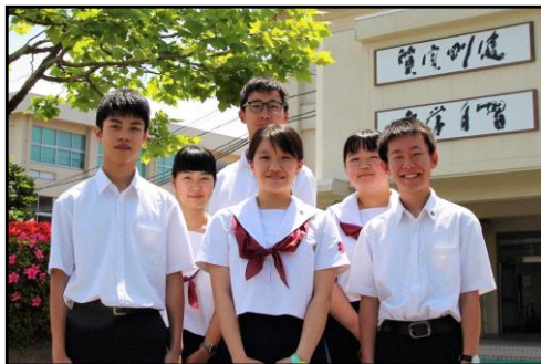
学校行事を創り上げる生徒会役員