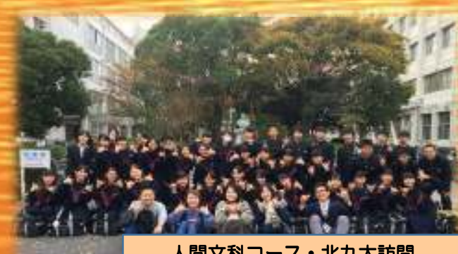
人間文科コース・北九大訪問