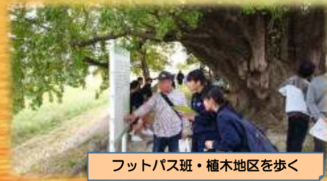
フットパス班・植木地区を歩く