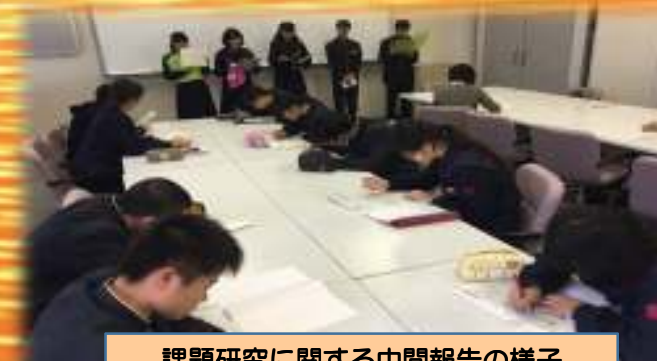
課題研究に関する中間報告の様子