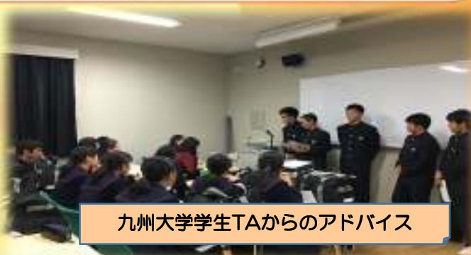
九州大学学生TAからのアドバイス