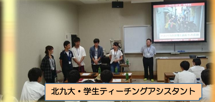
北九大・学生ティーチングアシスタント