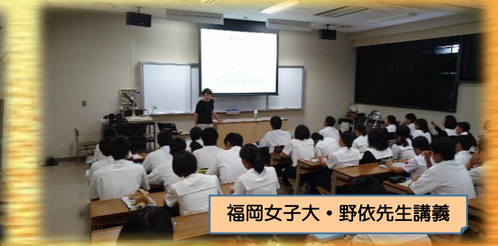
福岡女子大・野依先生講義